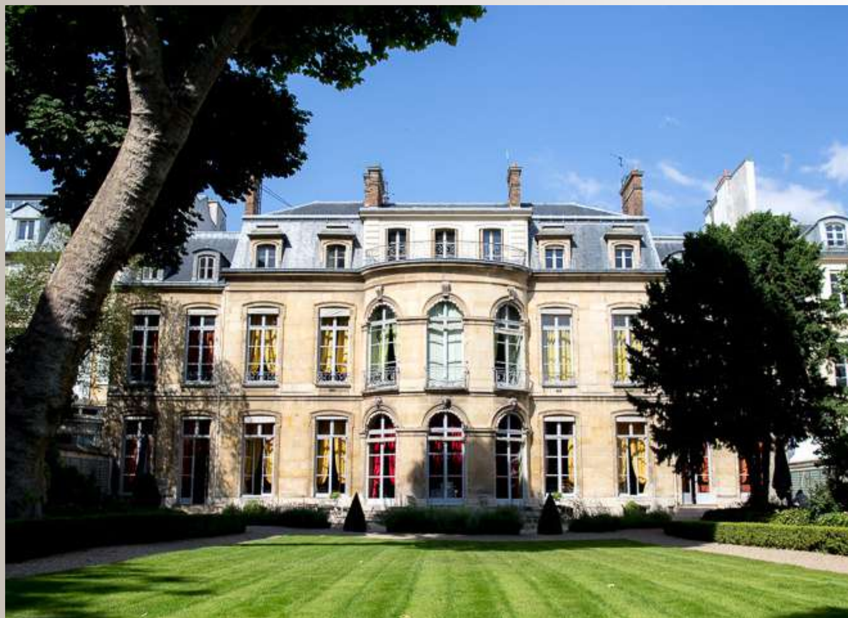
L'HÔTEL AMELOT DE GOURNAY